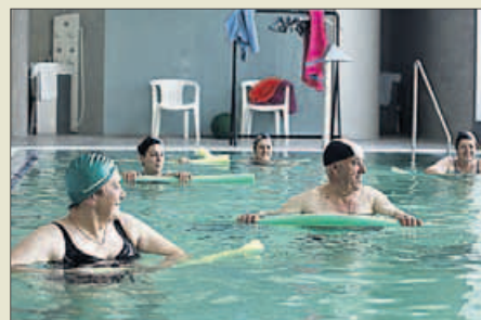
Usuarios, en un balneario.

■ Tienen propiedades diuréticas y actúan sobre el aparato digestivo. Son las únicas no presentes en los balnearios gallegos.