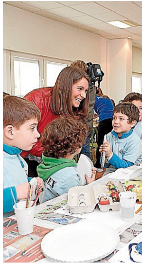
Nenos nun colexio

NENOS Xa se pode proceder a formalizar a matrícula no departamento de Educación para o programa de conciliación familiar do Concello para Semana Santa. O prazo remata o 10 de abril. O programa dirixido fundamentalmente a nenos e nenas de entre 3 e 12 anos terá lugar os días 14, 15, 16 e 21 de este mes no CEIP As Fontiñas". Poderase solicitar servizo de madrugadores. ECG