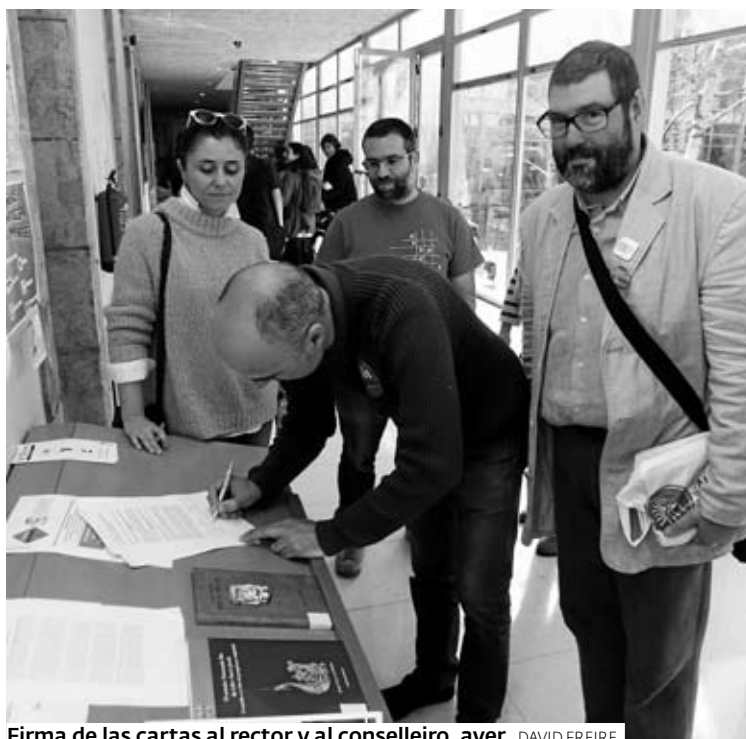
Firma de las cartas al rector y al conselleiro, ayer.

Según la propia plataforma, dicha incorporación ya se ha llevado a cabo con otro tipo de estudios, como en el caso de las escuelas de Enfermería o de estudios de Marina Civil, cuyos centros del