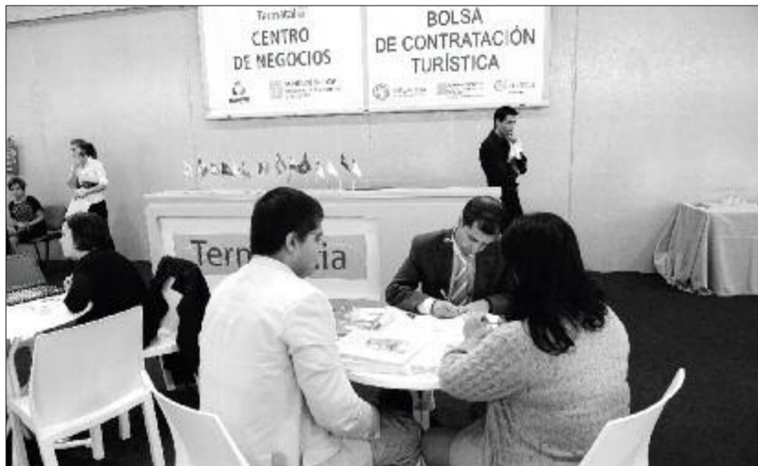
Mesas da área de centro de negocios e bolsa de contratación da edición do 2011 de Termatalia.

pero trasladándoa agora á época das novas tecnoloxías da información.