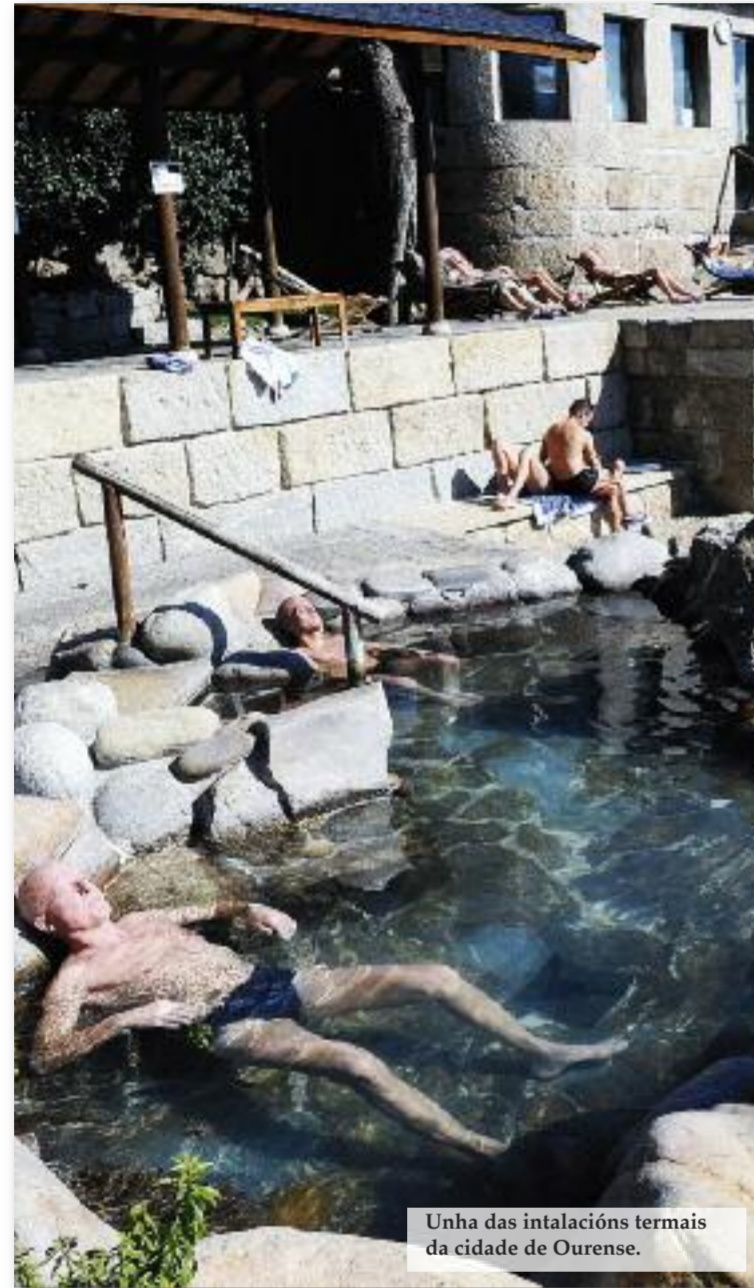
Unha das instalacións termais da cidade de Ourense.

Un factor clave nese sentido foi a constitución en 1985 da Asociación Galega da Propiedade Balnearia, nun momento no que "os balnearios parecían pertencer a un tempo fuxido, lugares aos que a sociedade dera as costas por mor dos avances médicos e do empuxe do turismo de sol e praia", sinalan dende esta entidade. Ao longo dos seus 28 anos de traxectoria resaltan que cambiou moito a percepción social dos balnearios e do termalismo. Agora esta asociación representa a máis do 90% do sec-