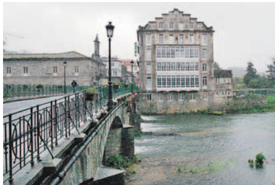
Las primeras aguas reconocidas. Las del balneario Acuña, en Caldas de Reis, fueron declaradas de utilidad pública en 1813.