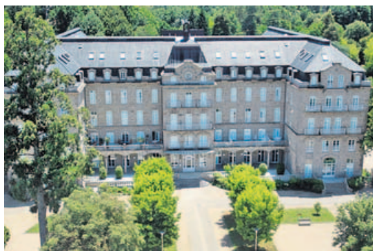
Centro sanitario. Los balnearios de Mondariz y Lugo fueron los primeros declarados como centros sanitarios, en 1998. FIRMA

española está en Galicia, de ahí que sea una de las principales líneas del Plan de Turismo. El termalismo ya es una realidad en la sanidad gallega, hasta el punto de que se está implantando el acceso a la historia clínica electrónica en estos establecimientos, para que los profesionales sanitarios