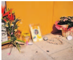
Homenaje ayer a la niña.