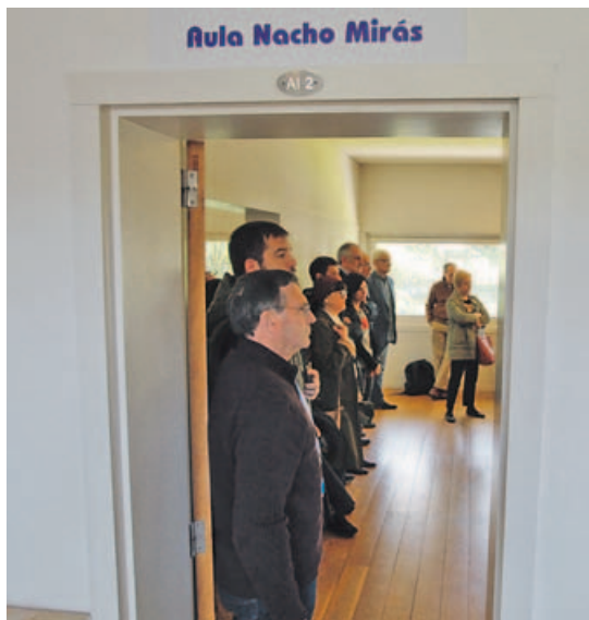
El aula Nacho Mirás se abrió en la Facultad de Periodismo.