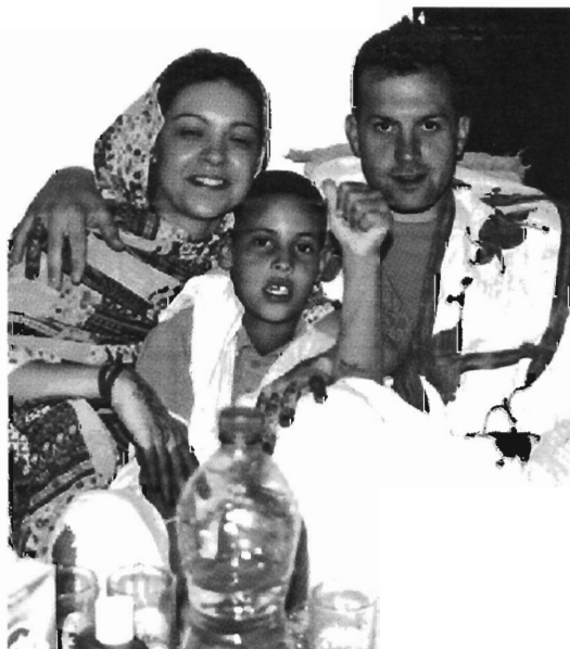
Algunas familias, como esta de Sarria, visitan a los niños en Tinduf.

Los pequeños aterrizarán en el aeropuerto de Lavacolla repartidos en dos grupos. El primero llegará en la madrugada del domingo al lunes, y el segundo lo hará del lunes al martes. Estarán en Galicia hasta los primeros días de septiembre. Las cifras de este año distan mucho de las registradas cuatro años atrás, cuando habían pasado el verano en Lugo 125 niños —88 más que este— acogidos en 123 familias de 41 concellos. «Hai algún pobo no que pagan a viaxe as familias», comentó Pacín, que señaló que prevén que los pequeños volverán a llegar en una situación muy precaria.