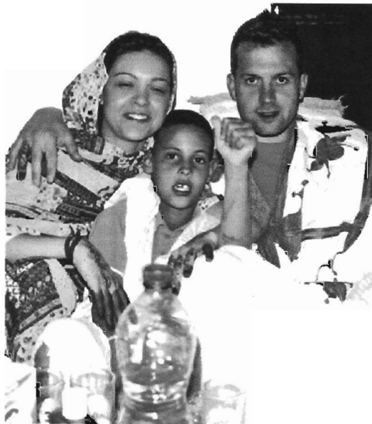
Algunas familias, como esta de Sarria, visitan a los niños en Tinduf.

Los pequeños aterrizarán en el aeropuerto de Lavacolla repartidos en dos grupos. El primero llegará en la madrugada del domingo al lunes, y el segundo lo hará del lunes al martes. Estarán en Galicia hasta los primeros días de septiembre. Las cifras de este año distan mucho de las registradas cuatro años atrás, cuando habían pasado el verano en Lugo 125 niños —88 más que este— acogidos en 123 familias de 41 concellos. «Hai algún pobo no que pagan a viaxe as familias», comentó Pacín, que señaló que prevén que los pequeños volverán a llegar en una situación muy precaria.